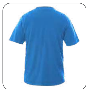
zadní strana zadná strana back side z tyłu